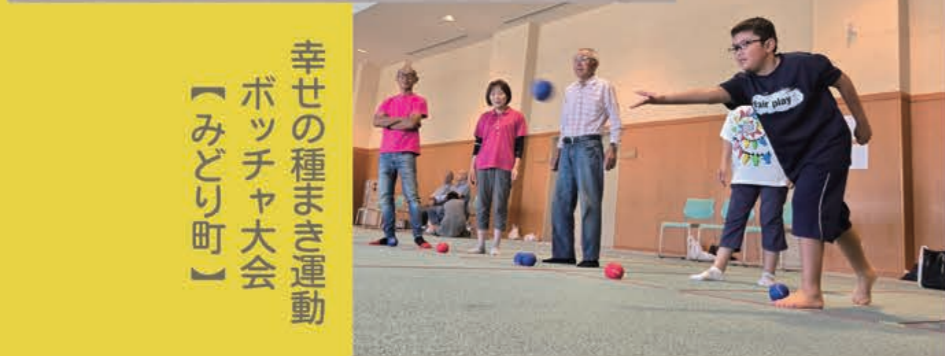
幸せの種まき運動 ボッチャ大会 【みどり町】