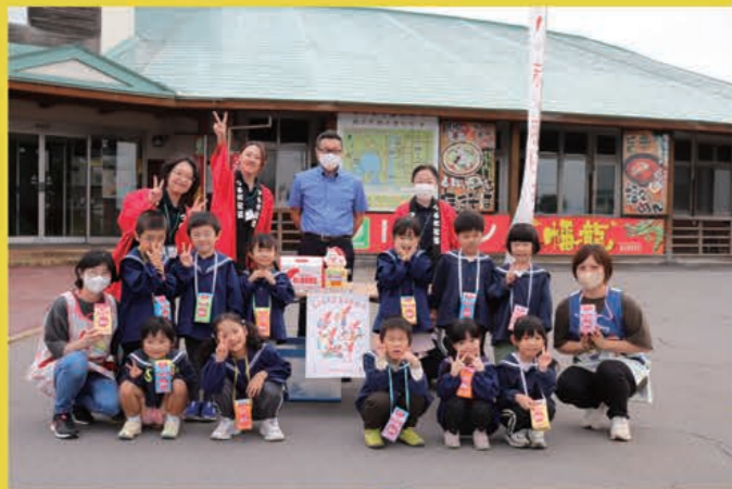
赤い羽根共同募金 街頭募金活動 【いとも園つるのこ】

通称は「社協」と言い、地域のさまざまな公民の関係者により構成され、地域が抱えている様々な福祉問題を地域全体の問題としてとらえ、話し合い、活動を計画し、さまざまな活動者や活動団体、地域住民などと相互に協力して解決を図りながら、その活動をおして、福祉コミュニティづくりと地域福祉の推進を目指しています。