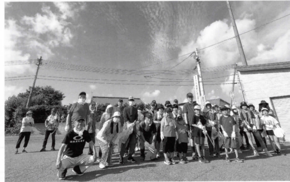
▲瀬良沢 クリーン作戦