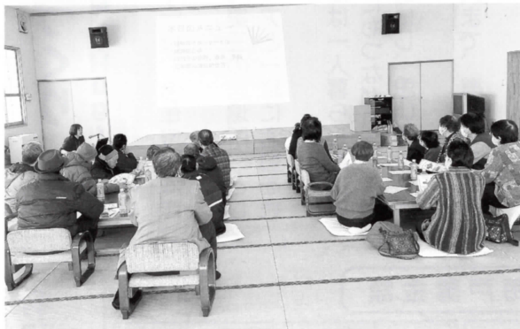
▲菖蒲川 認知症サポーター養成講座&お楽しみ会