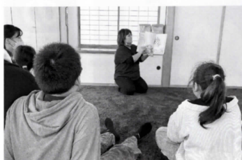
▲寄付でいただいた絵本の読み聞かせ会