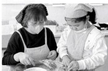
▲バレンタインおかし作り