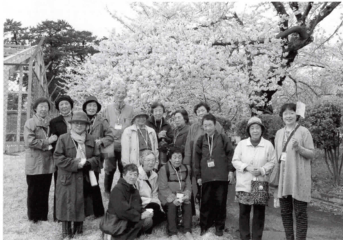
▲昨年の芦野公園お花見ツアーの様子