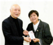
▲鶴田地区 更生保護女性会