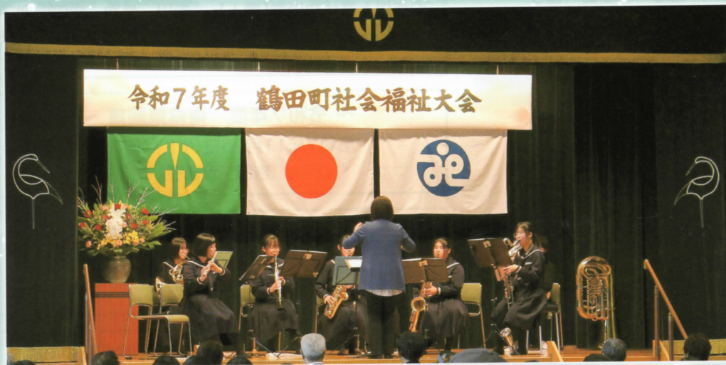
△鶴田中学校 吹奏楽部による演奏