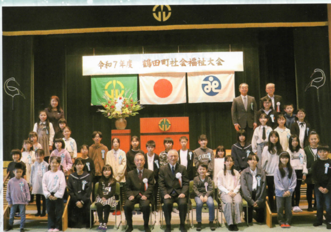
△福祉作文コンクールに入賞した児童生徒の皆さん

昨年12月6日(土)、鶴遊館ふれあい広場において、令和7年度 鶴田町社会福祉大会が開催されました。 オープニングセレモニーでは、鶴田町立鶴田中学校吹奏楽部のみなさんが演奏し、迫力ある素晴らしい演奏に、会場からは大きな拍手が送られました。 大会では、鶴田町の福祉に貢献された個人・団体への表彰が行われ、米寿を迎えられた皆さんへ記念の手形が贈呈されました。 最後は、福祉作文コンクールの表彰と最優秀賞に選ばれた児童生徒の朗読発表で幕を閉じました。