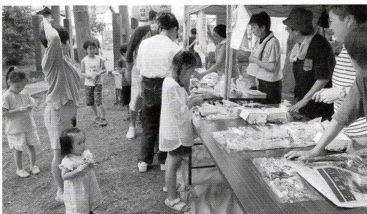
▲ 7/22 (中野) 夏祭り

令和5年5月8日からの新型コロナウイルス感染症の第5類移行後、ようやく以前の日常生活に戻りつつあり、各地で祭事をはじめとする地域行事や地域活動が本格的に再開してきています。幸せの種まき運動・福祉デイも令和5年度より再開し、各地域で特色のある活動が実施されました。