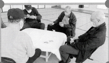
ゴニンカンクラブ