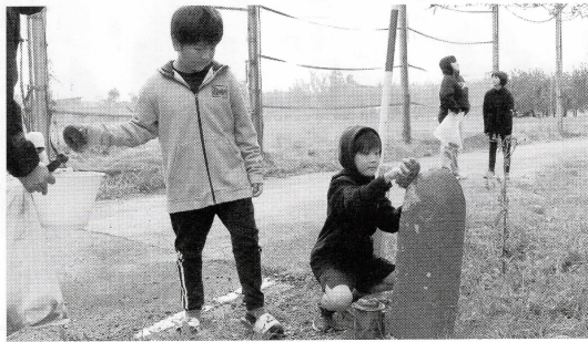
▲ 10/22 (亀田) ごみ拾い