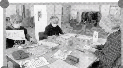
脳の健康教室 脳楽寺子屋