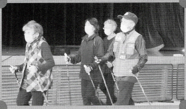
ノルディック・ウォーク