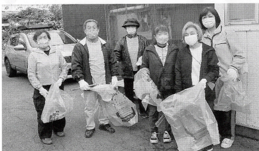
▲ 10/15 (本町) クリーン作戦

地域の身近な場所ですぐに集い楽しく過ごすことで、地域の活性化と住民 同士の「つながり」を深め、社会参加が困難になった高齢者の閉じこもり防止や介護予防になり、また、地域全体で子どもや困り事を抱えた方を気にかける、そんな「助け合い」「支え合い」を育む地域づくりにつながっていきます。