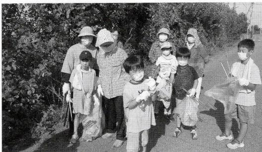
▲ 8/6 (瀬良沢) ごみ拾い

令和5年5月8日からの新型コロナウイルス感染症の第5類移行後、ようやく以前の日常生活に戻りつつあり、各地で祭事をはじめとする地域行事や地域活動が本格的に再開してきています。幸せの種まき運動・福祉デイも令和5年度より再開し、各地域で特色のある活動が実施されました。