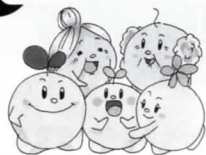
鶴田社協イメージキャラクター たねまきくん