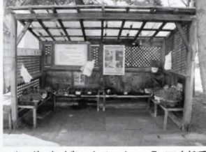
▲ 生きがいセンター入口付近