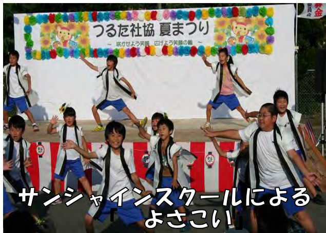
サンシャインスクールによる よさこい