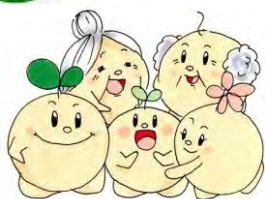
幸せの種まき運動事業 イメージキャラクター