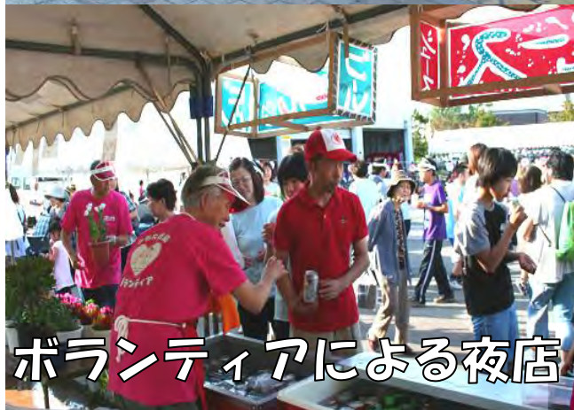
ボランティアによる夜店